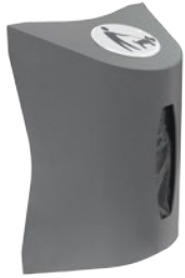
Dispensador de bolsas Can-Adapt Estándar Vertical