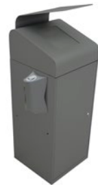
Berlín Urbana con Can-Adapt