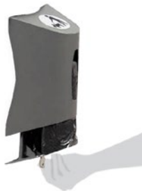
Reposición de bolsas