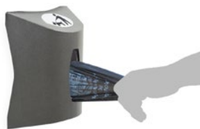
Extracción de bolsa