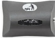
Dispensador de bolsas Can-Adapt Estándar Horizontal